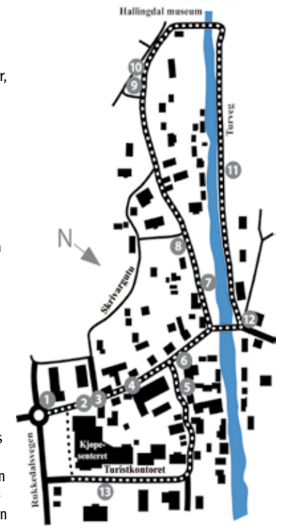
Figur-vandring Mer info Nesbyen turistkontor/More info at Nesbyen tourist office

The Otto figures. A figure walk is a walk through Old Nes, which is the oldest part of Nesbyen centre. Thirteen figures brings you around to Hallingdal Museum, historical roads, the famous Rukkedøla river, galleries and art shops. In the old part of Nes you experience gentry's houses and farm houses side by side. The architecture gives Nesbyen a special atmosphere and an interesting history. Take the figure trip on bike. Welcome!